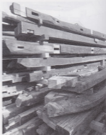
解体した古民家から買い取った古材

結露で長いものは1本の古材梁として店舗などで使える一方で、短い古材はこれまで廃棄せざるを得ませんでした。しかし、ピースとして「部材化」することで再利用ができます。このように古